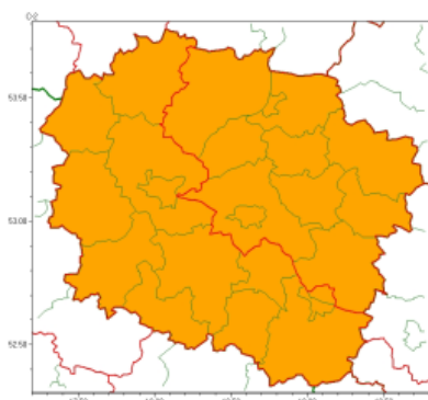
Upał 2024-07-15 23:50